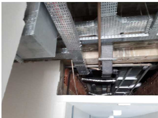
Fig. 15 – Na circulação, na conexão da área nova com a área de reforma, o fechamento do forro não foi feito;