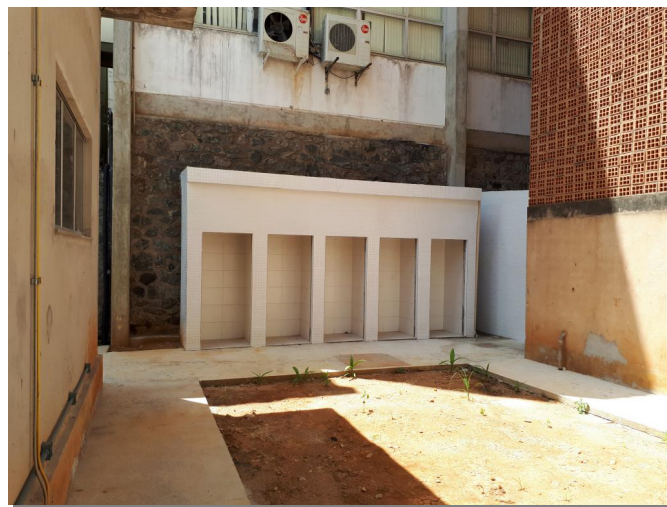
Fig. 10 – Casa de Recicláveis sem porta instalada;