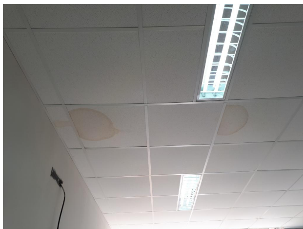
Fig. 17 – SALA MULTIUSO – Mancha de infiltração no forro;