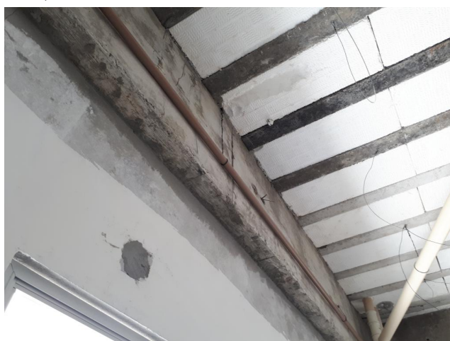
Fig. 19 – ARQUIVO REFRIGERADO 01 – Paredes internas sem acabamento de pintura;