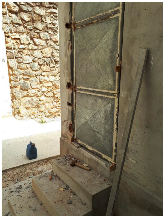
Fig. 9 – Porta do Arquivo Refrigerado;