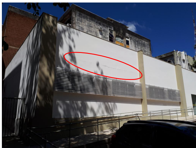
Fig. 3 - Fissura na fachada, no encontro da viga com alvenaria;