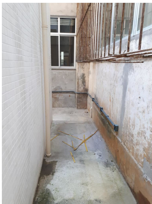
Fig. 6 – Falta pintura externa (salvo da fachada principal);