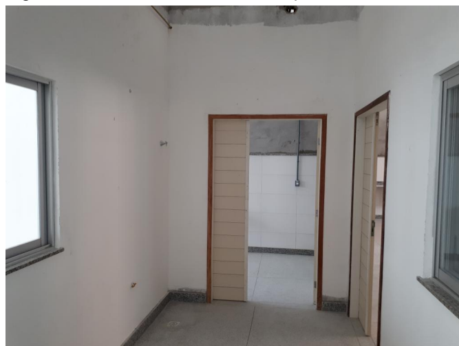
Fig. 12 – Portas internas sem pintura de alisar e batedor;