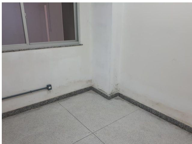
Fig. 16 – SALA DE MICROSCOPIA 12.58m² - Infiltração no piso e parede;