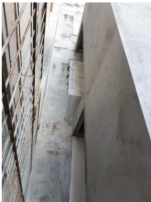
Fig. 7 – Caixa do elevador sem fechamento e sem equipamento instalado;