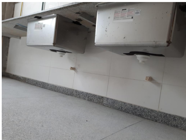
Fig. 13 – SALA DE CORTE - Paredes internas precisam ser complementadas até a laje e paredes pintadas;