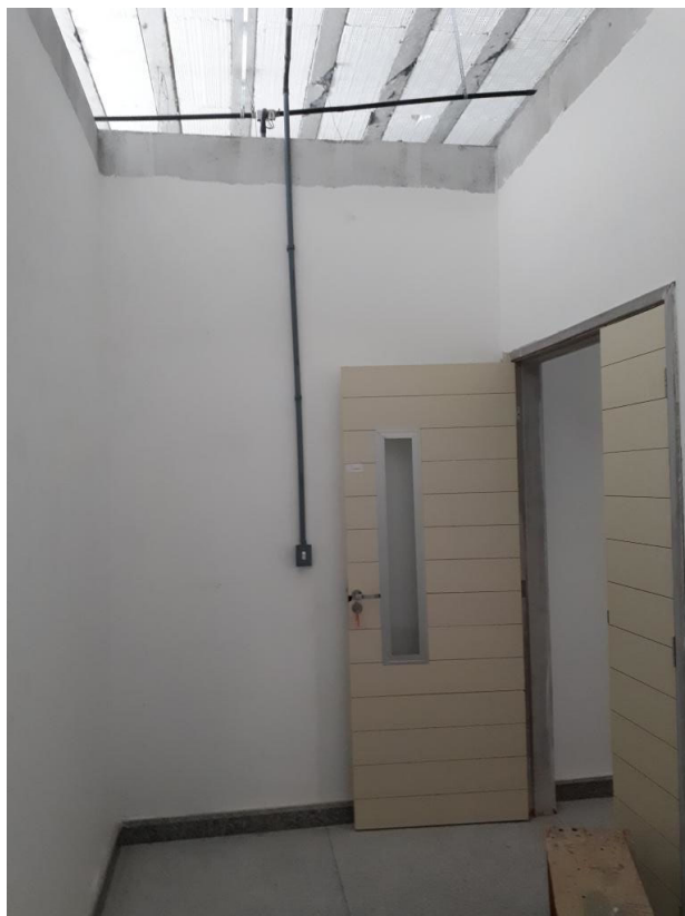
Fig. 18 – LAB. LIMPEZA PUGLES – CAPELA – Forro e luminárias não instalados;