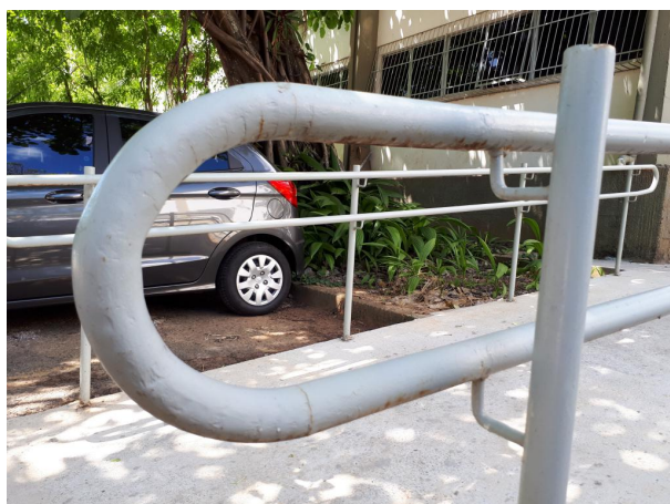
Fig. 1 - Oxidação no guarda-corpo