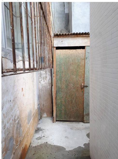
Fig. 8 – Gradis de janelas existentes oxidados;