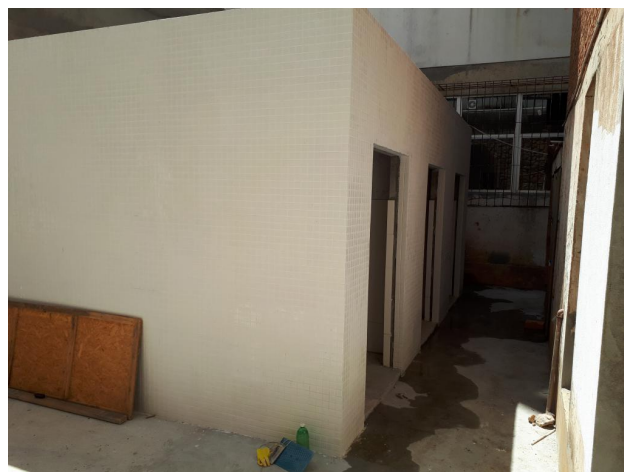
Fig. 4 – Casas de gás revestidas externamente, mas sem portas instaladas;