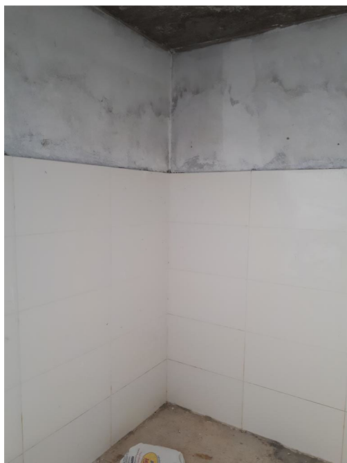
Fig. 5 – Falta pintura interna das casas de gás;