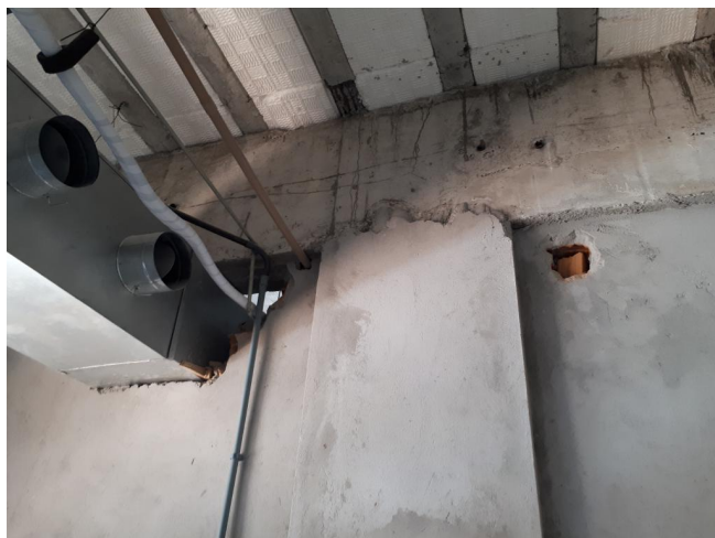
Fig. 14 – LAB. RED. GRANULOMÉTRICA – Dutos de exaustão instalados parcialmente;