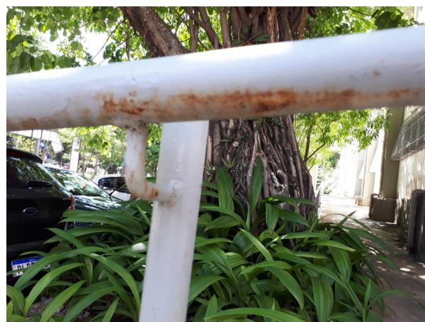
Fig. 2 - Oxidação no guarda-corpo