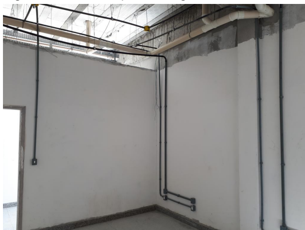
Fig. 11 – LAB. ANÁLISE SEDIMENTOLÓGICA - Paredes internas precisam ser complementadas até a laje e paredes pintadas;